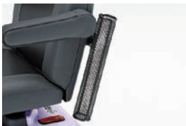
ステッキホルダー