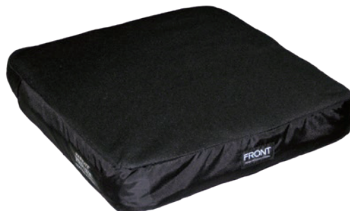
735001-16162 ● TAIS 00468-000034 幅 40 × 奥行 40 × 厚さ 8cm 重量 0.7kg