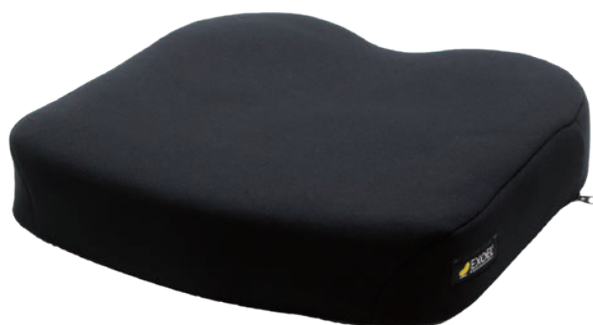
■ エクスジェルとウレタンフォームの積層構造