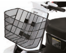
大型フロントバスケット

バックミラー (スキップα用) ● TAIS 00228-000021 ステッキホルダー (スキップα・スマイル共通) ● TAIS 00228-000017 ステッキホルダー (フジ用) ● TAIS 00020-000049 大型フロントバスケット (スキップα用) ● TAIS 00020-000037 大型フロントバスケット (フジ用) ● TAIS 00020-000050 リヤバスケット (スマイル用) ● TAIS 00020-000041 酸素ボンベキャリアラック (スマイル用) ● TAIS 00020-000040