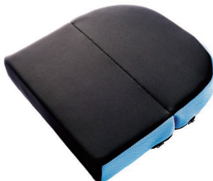
CK-405 TAIS 00206-000132 幅 40 × 奥行 40 × 厚さ 6cm 重量 0.6kg