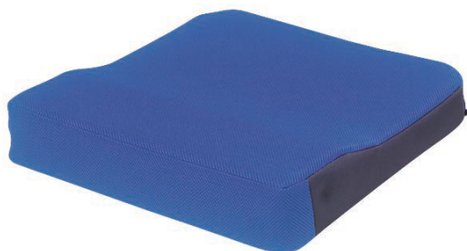
MSPBL TAIS 00054-000030 幅 40 × 奥行 40 × 厚さ 5cm (最厚部 7cm) 重量 1.3kg