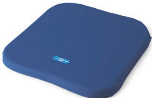
AAK01 TAIS 00175-000302 幅 40 × 奥行 40 × 厚さ 3.5cm 重量 0.9kg